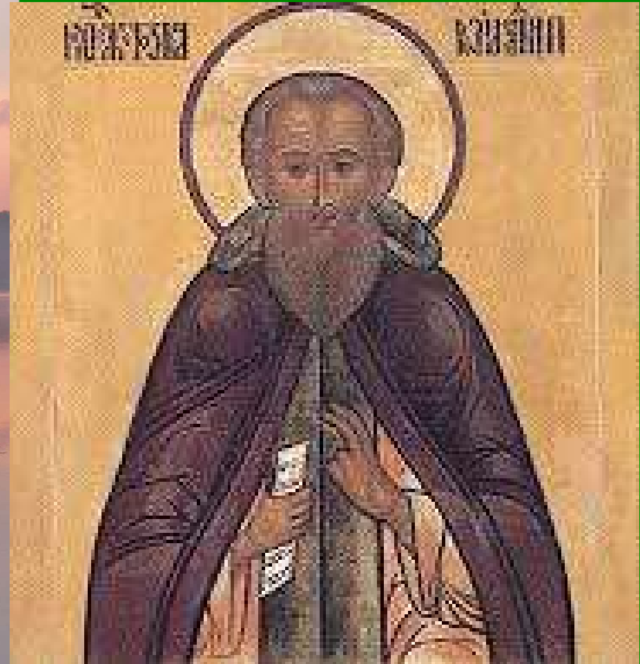
Св. преподобный Савва Сторожевский